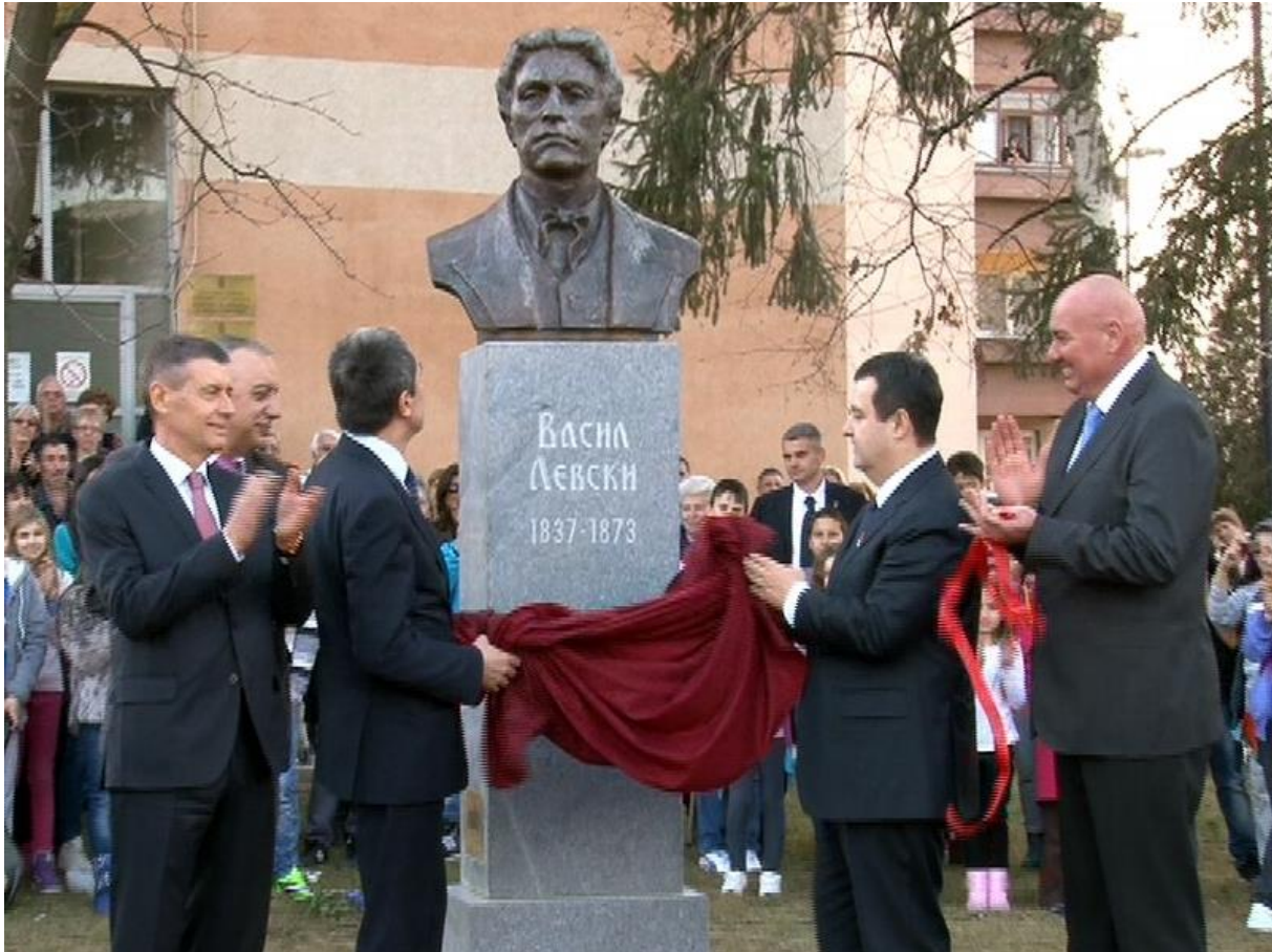
Slika 1: premijeri Orešarski i Dačić otkrivaju bistu Vasila Levskog, Dimitrovgrad, 19. februar 2014. 9

Vigenjin je u uzvratnoj poseti Beogradu početkom jula razgovarao sa Ivicom Dačićem, koji je nakon martovskih izbora preuzeo funkciju ministra spoljnih poslova. U razgovoru je dominirala tema Južnog toka, o kojem će reći više biti kasnije. Ubrzo nakon ove posete usledili su i izbori u Bugarskoj, nakon čega je BSP predala vlast GERB-u Bojka Borisova. Novi bugarski ministar spoljnih poslova Daniel Mitov je 13. marta 2015. posetio Beograd, potvrđujući visok nivo odnosa i ponovo dajući značaj infrastrukturnim projektima. Dotičući se pitanja nacionalnih manjina, Dačić je rekao da „u